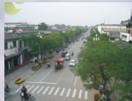
Vues de la Cité Ming de la ville de Qufu